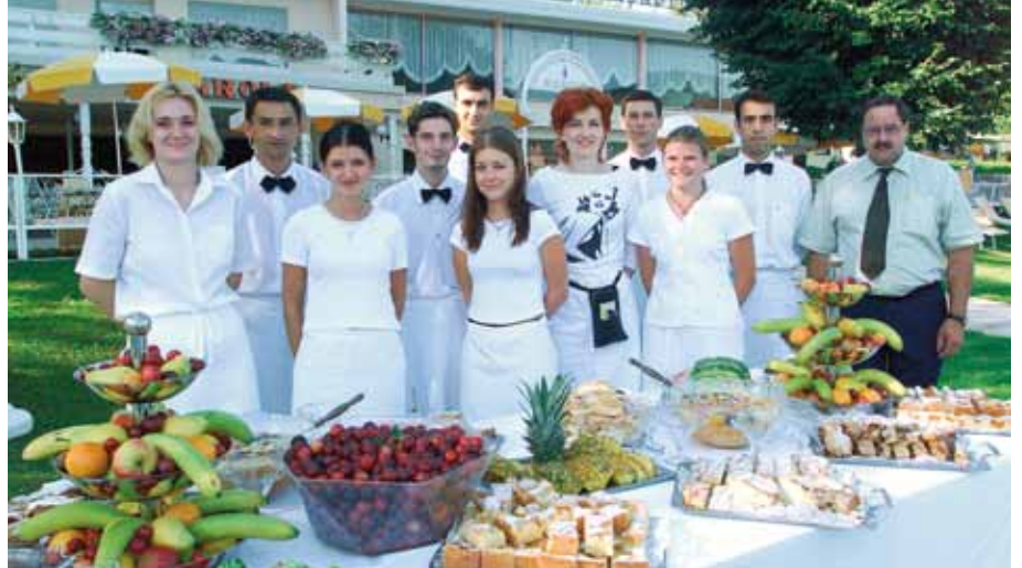
Unser Marolt-Team für Sie am Strandbuffet