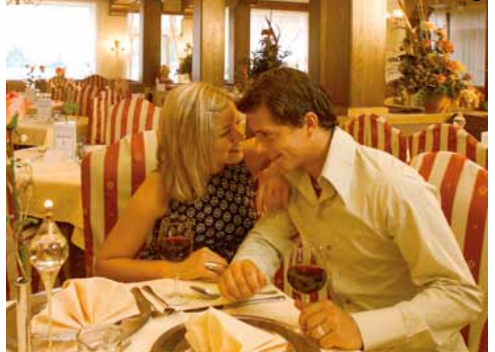
Glücklich sein bei gutem Glas Wein