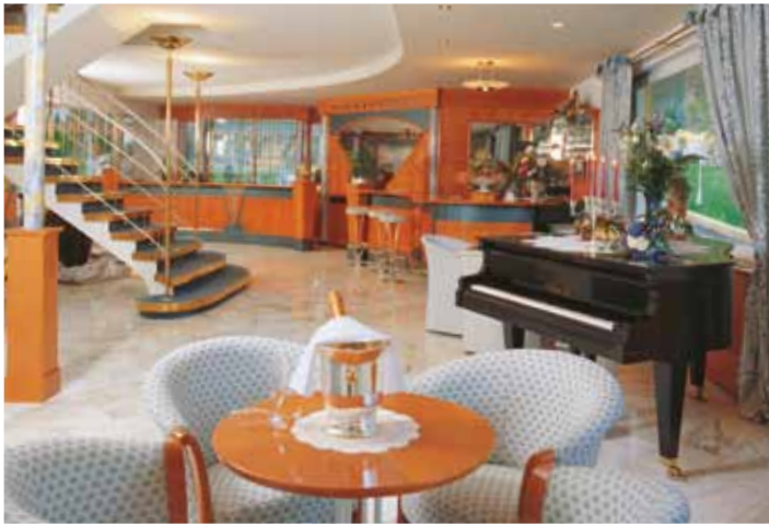
Elegantes Flair in der Hotelhalle