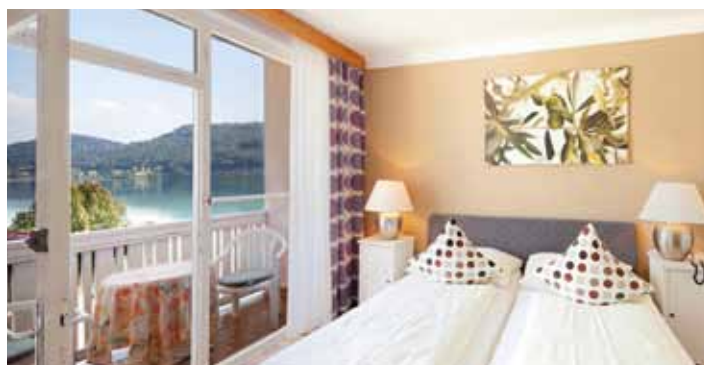
... zeitgemäß ...