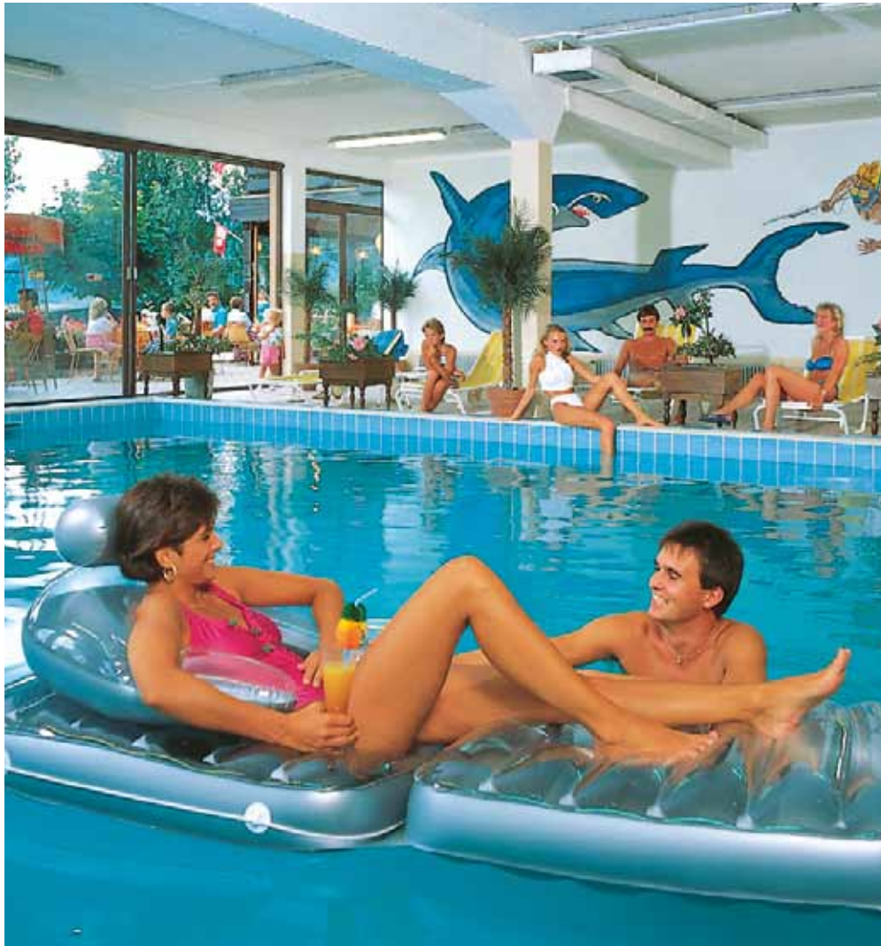
Herrlich temperiertes Hallenschwimmbad (18 x 8 m) mit 28 – 30 Grad Wärme