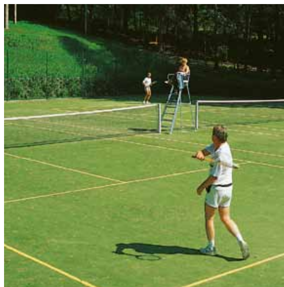
Zwei hauseigene Sandrasenplätze