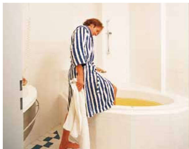
Mit Dusche, Bad oder Whirlpool