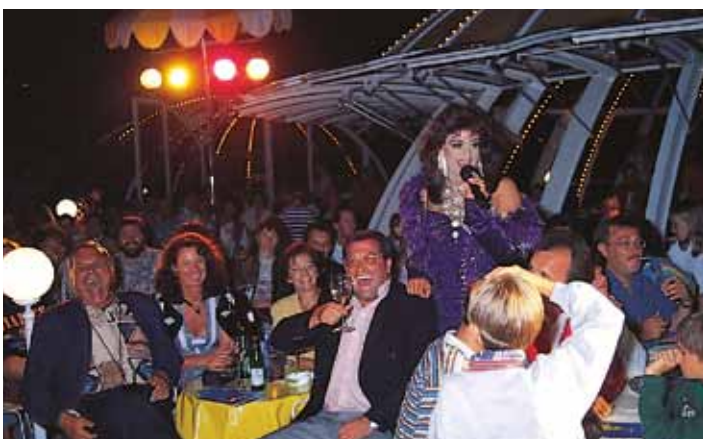
Musik, Show und Entertainment, wöchentlicher Tanzabend