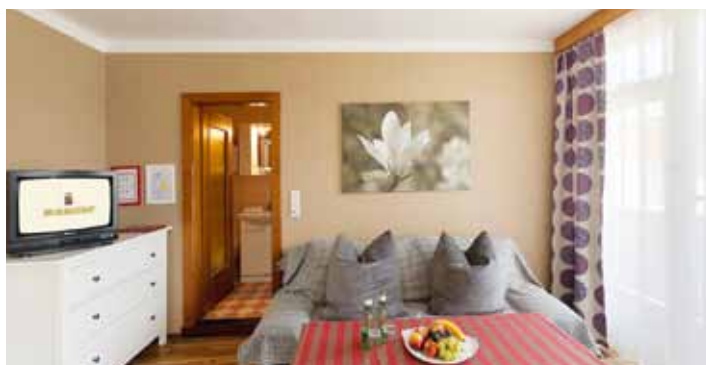
... behaglich ...