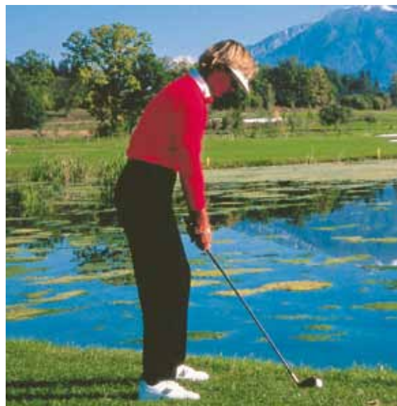
18 Loch, Par 72, 450 m Seehöhe, Driving Range, Putting-Green, Bunker