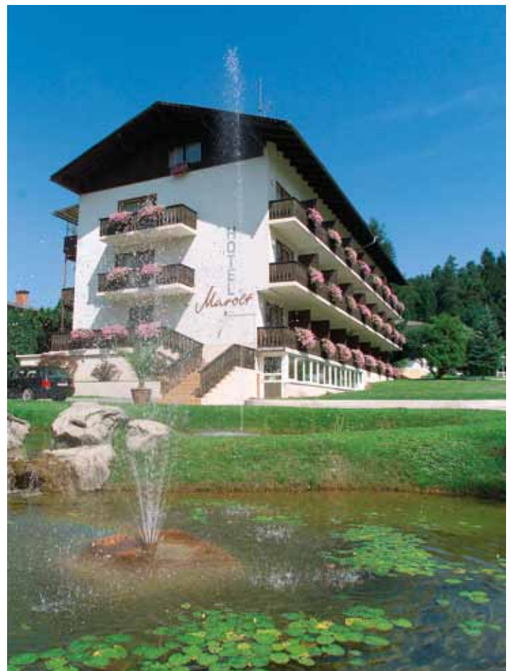
Biotop und Wasserspiele