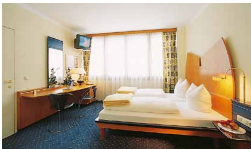
Modern exquisite Hotel-Appartements

Hotel-Appartement De Luxe“: 2 Doppelzimmer mit Verbindungstür, beide Zimmer verfügen über Dusche/WC oder Whirlpool/ WC, Sat-TV und Telefon.