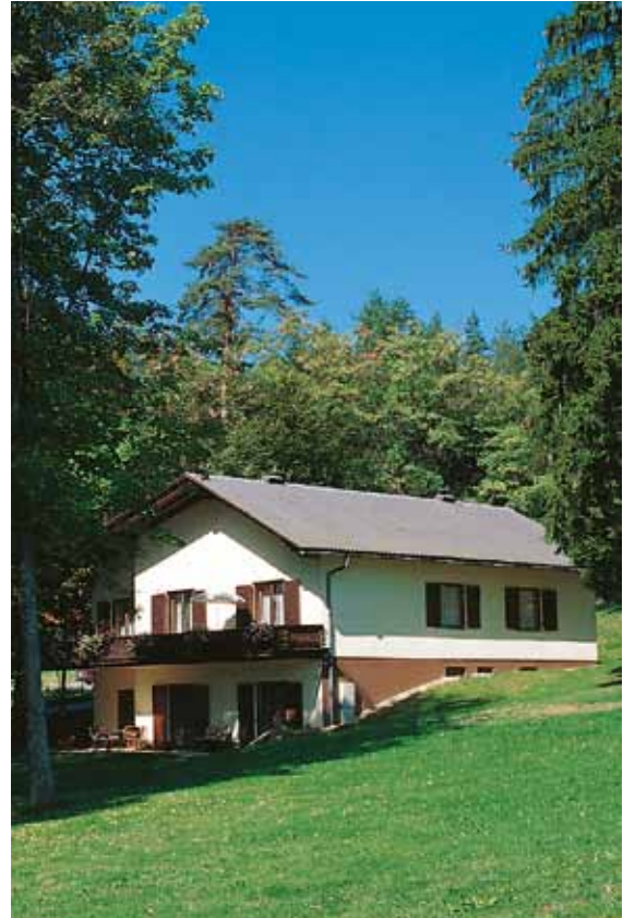
13.000 m² Park- und Liegewiese vor dem Haus