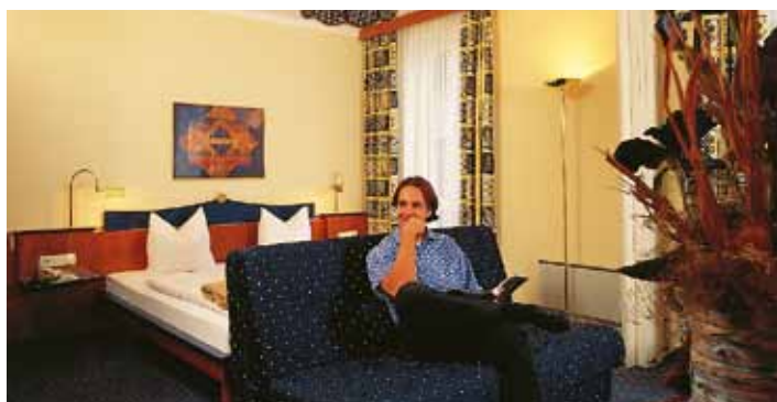
... gemütlich ...