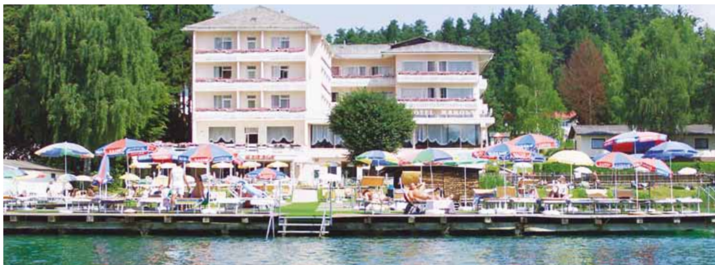
Eigenes Strandbad mit Liegewiese, Kabinen, Sonnenschirmen und Sonnenliegen, Tretbooten

Promenaden-Strandhotel Marolt mit Hallenbad, direkt am See und Promenade gelegen. Lift für die Kategorien 1 bis 7 vorhanden.