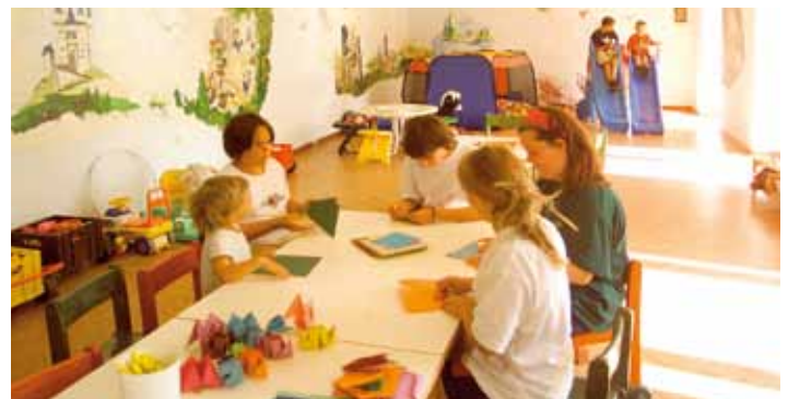
Kinderclub mit Kinderbetreuung im Juli/August im Haus