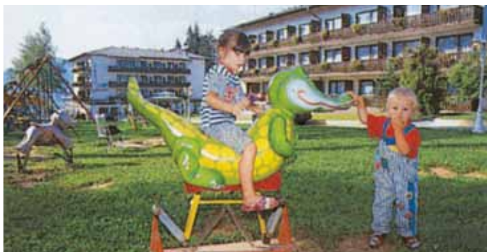
Kinderspielplatz vor der Hotelanlage