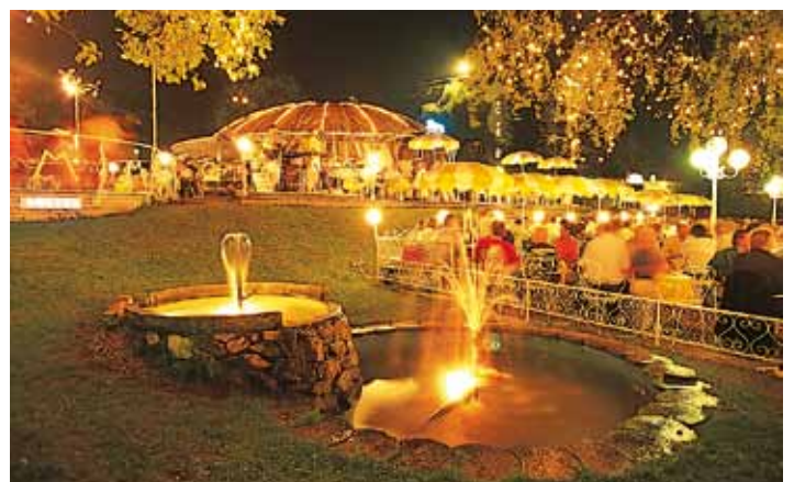
Marolts Blaue Lagune-Park Marolt