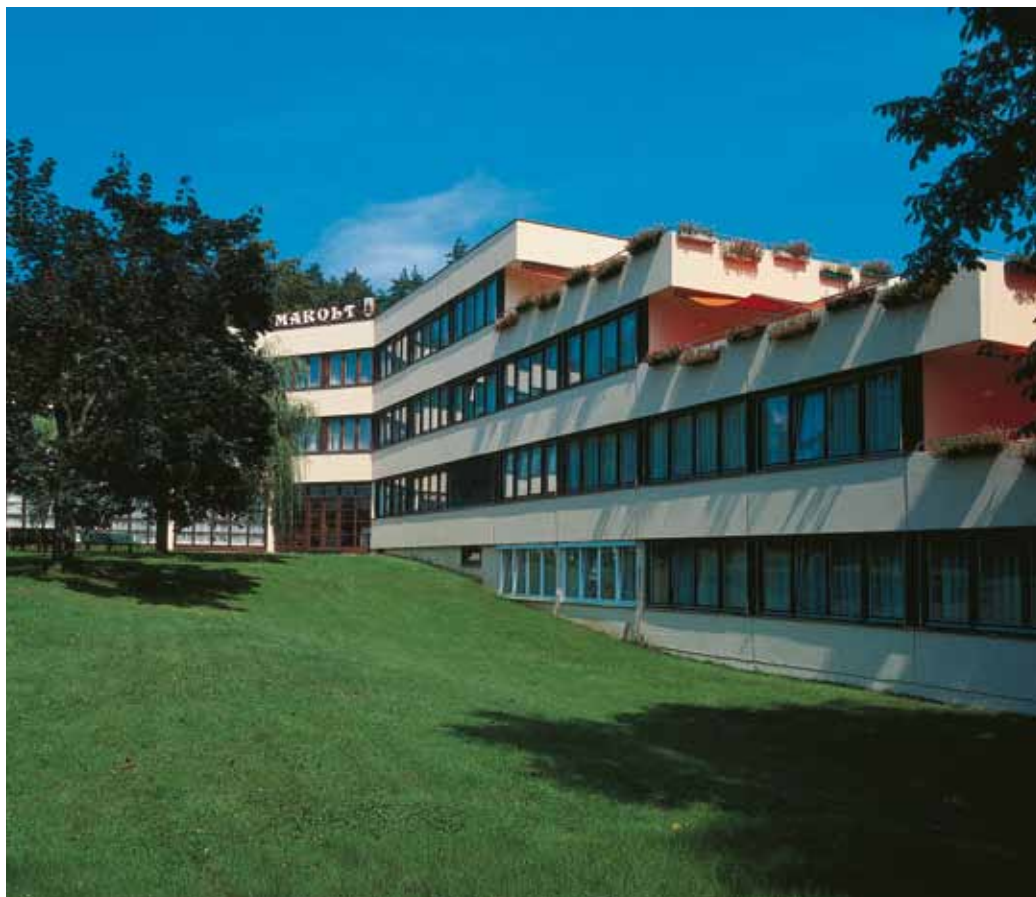
geräumige Sonnenterrassen auf jeder Etage

Appartement-Hotel Marolt mit eigenem Strand und großzügigen Liegewiesen in unmittelbarer Seenähe auf dem Areal des Promenaden-Strandhotels gelegen, sodass neben dem sich im Haus befindlichem großen Aufenthaltsraum auch die Annehmlichkeiten des Haupthauses samt Hallenbad mitbenützt werden können.