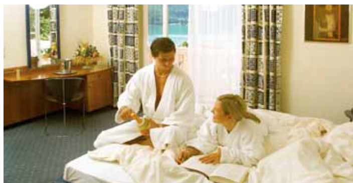
... komfortabel ...