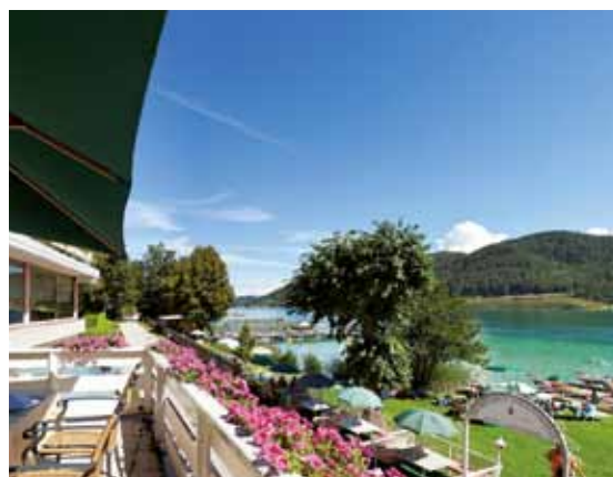
Hotel See Terrasse